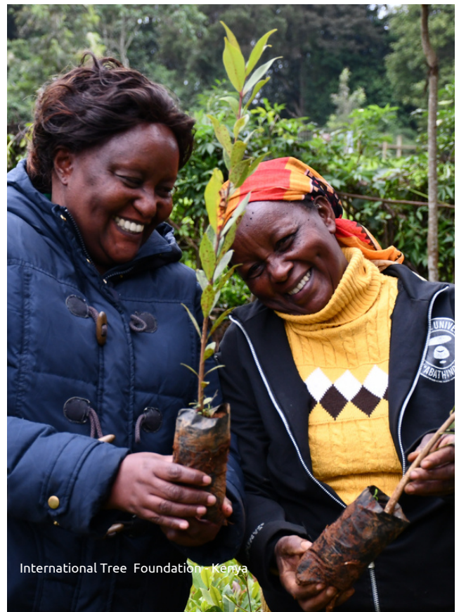
International Tree Foundation - Kenya