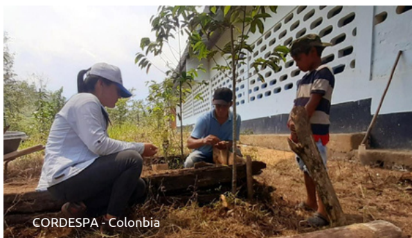
CORDESPA - Colombia

Respecter les savoirs et la sagesse collective des peuples sur la nature et les lieux où ils habitent