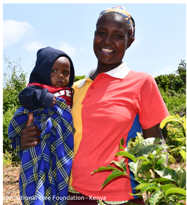
International Tree Foundation - Kenya