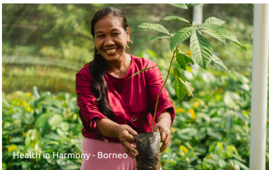
Health in Harmony - Borneo

Renforcer ou assurer le maintien de la connexion et les liens avec la nature.