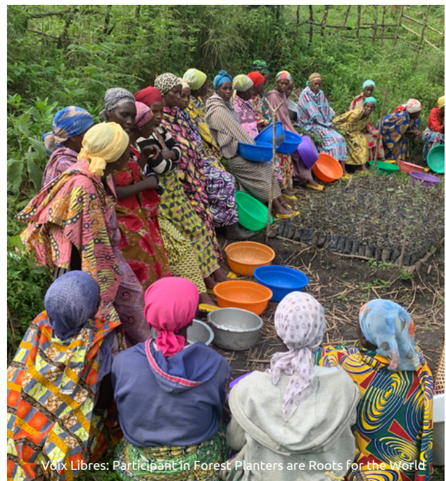
Voix Libres: Participant in Forest Planters are Roots for the World