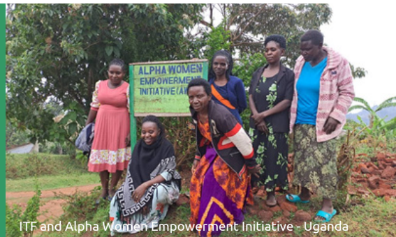
ITF and Alpha Women Empowerment Initiative - Uganda